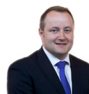
Darren Millar Y Pwyllgor Cyfrifon Cyhoeddus Ceidwadwyr Cymreig Gorllewin Clwyd