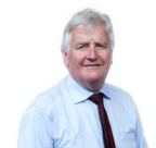
Alun Ffred Jones Y Pwyllgor Amgylchedd a Chynaliadwyedd Plaid Cymru Arfon