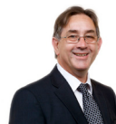
Mick Antoniw Y Pwyllgor Safonau Ymddygiad Llafur Cymru Pontypridd